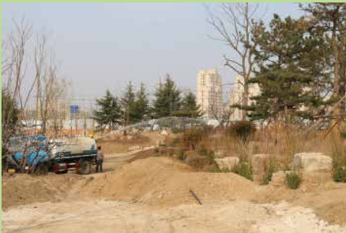
施工现场洒水抑尘