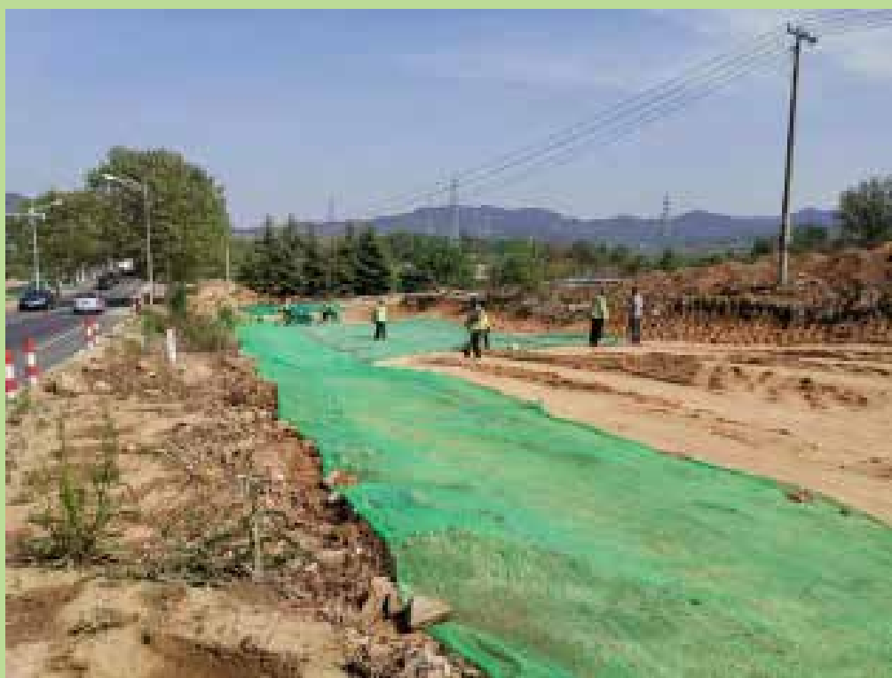
施工现场裸土遮盖