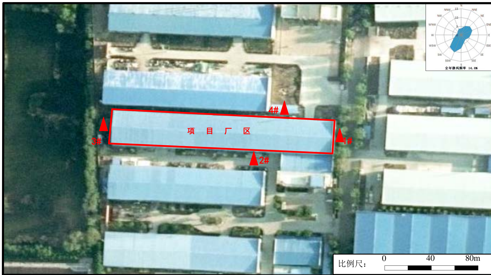
图 9.2-2 厂界噪声监测布点示意图