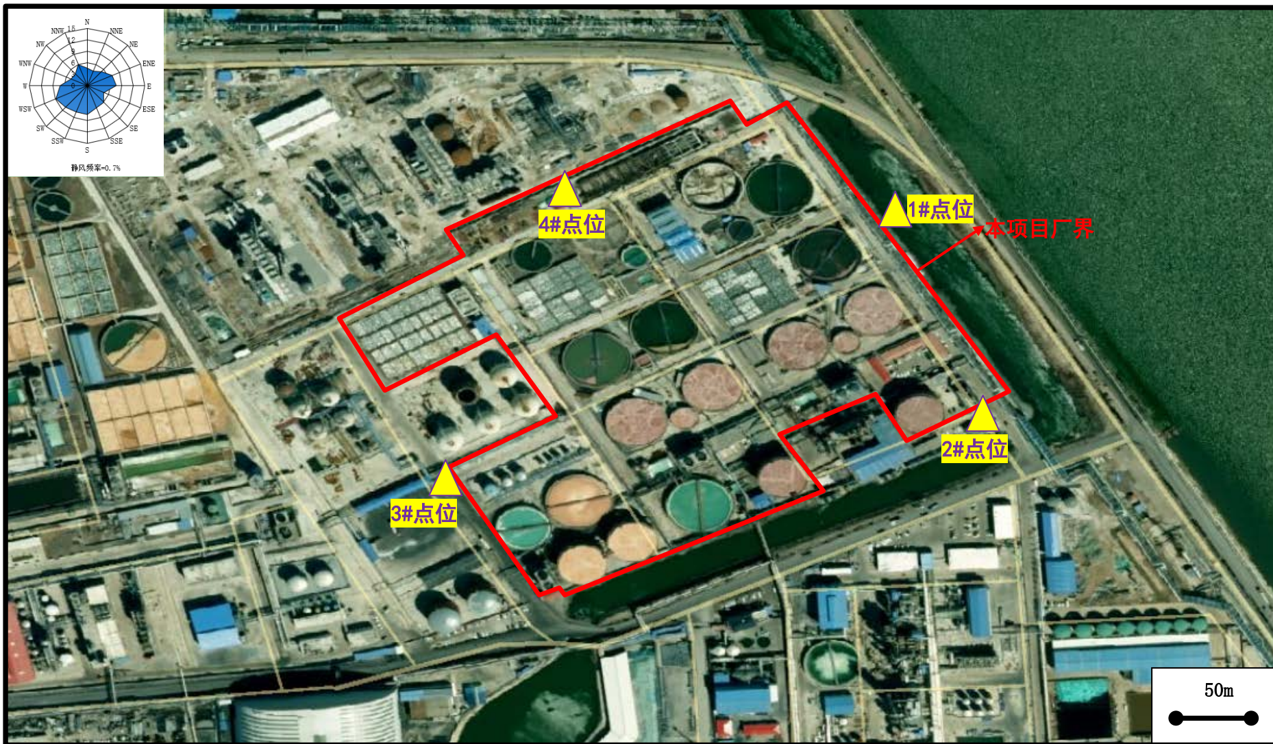
图 9.2-2 项目厂界噪声监测布点示意图