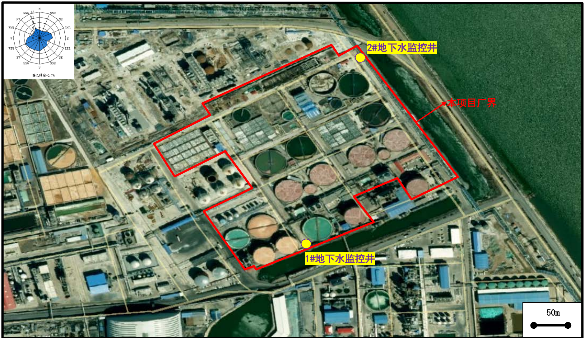
图 4.2-5 项目地下水监控井分布图