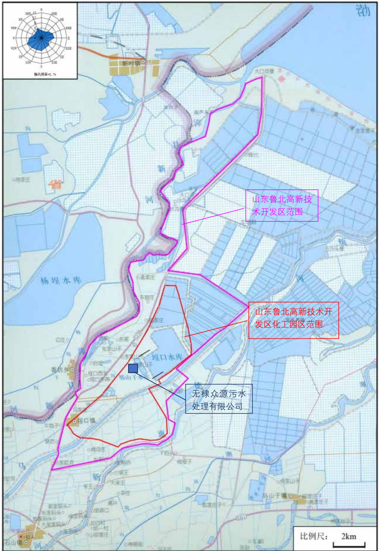
图 3.1-1 项目地理位置图