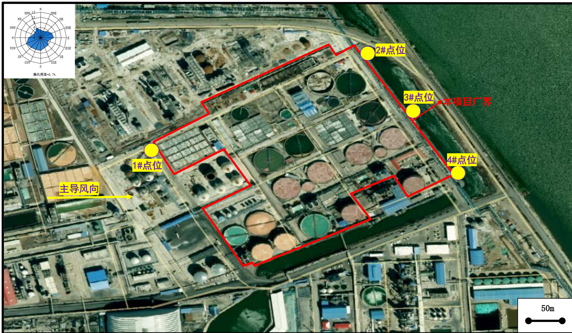
图 9.2-1 项目无组织废气监测布点示意图